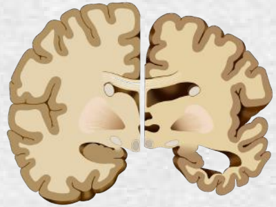
Cerveau sain Cerveau malade

La maladie d'Alzheimer est une démence neurodégénérative progressive dont les troubles sont multiples.